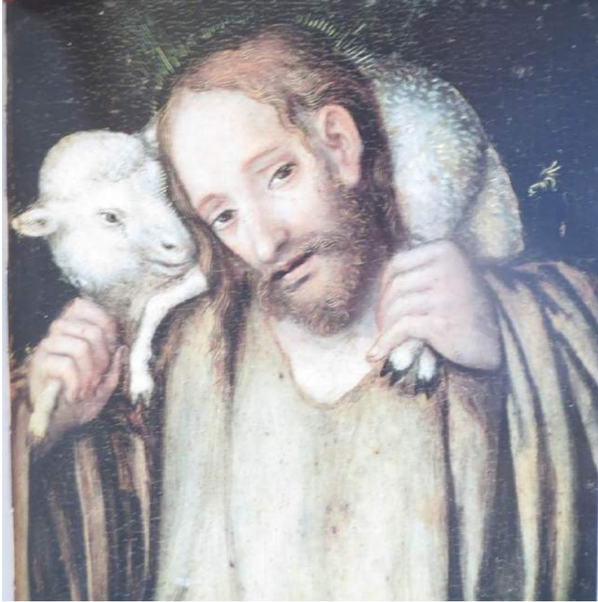
Lucas Cranach, Angermuseum Erfurt

Zum 25. April, dem Vierten Ostersonntag – Sonntag des Guten Hirten: