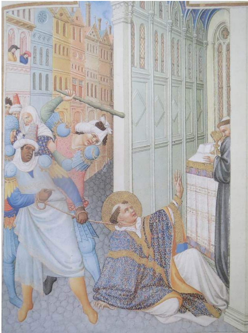
Martyrium des hl. Markus – Tres riches heures des Duc de Berry

Zum 25. April, dem Fest des heiligen Evangelisten Markus: