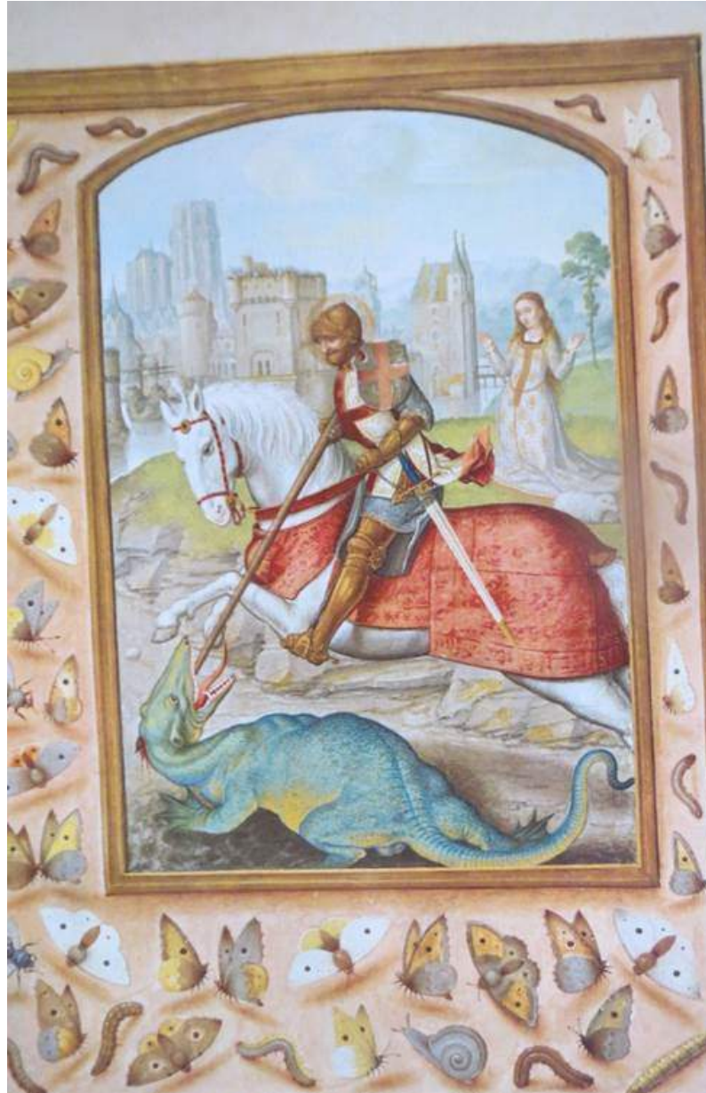
Breviarium Grimani, Brügge um 1515

Zum 23. April, dem Fest des heiligen Georg :